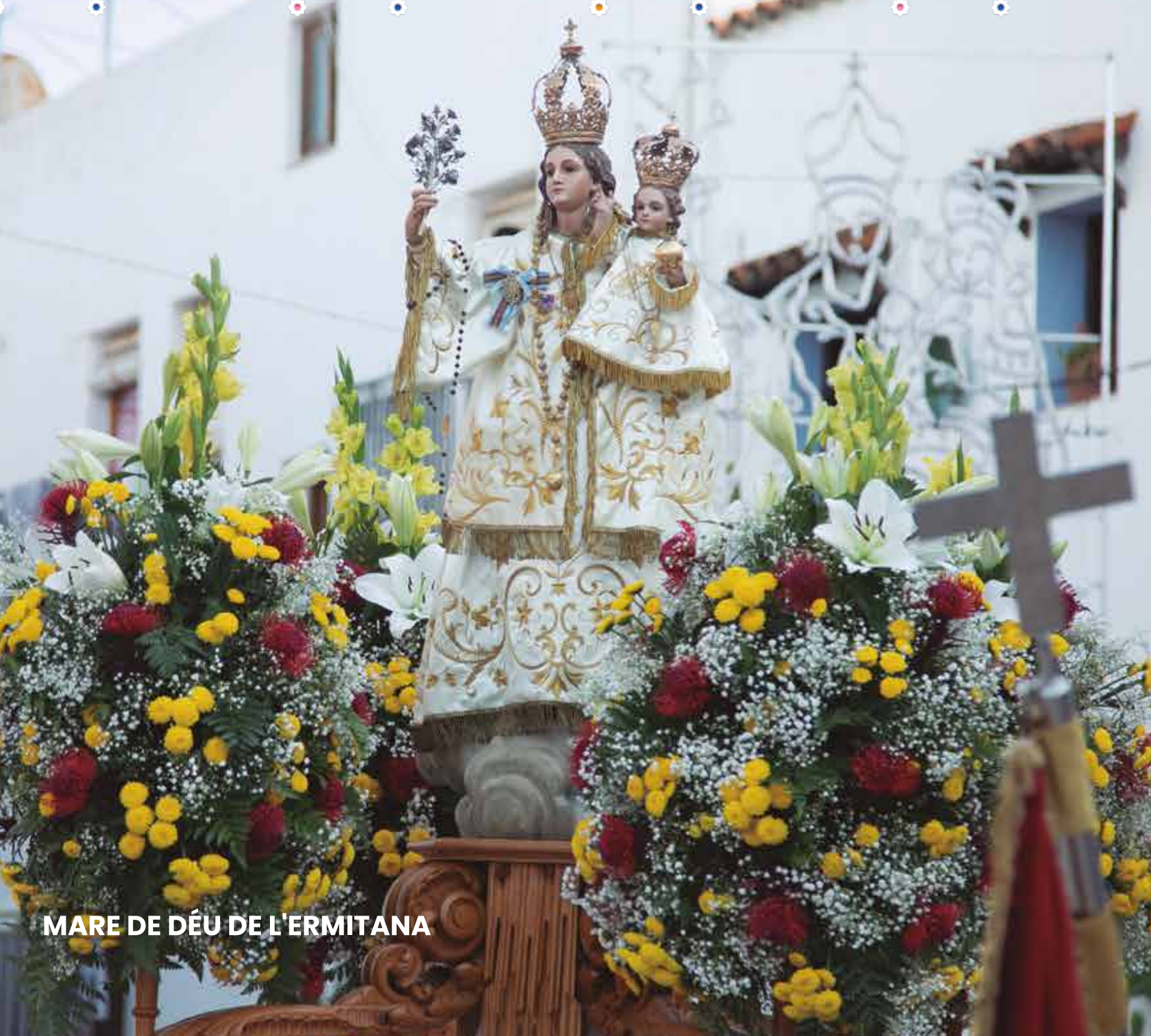
MARE DE DÉU DE L'ERMITANA